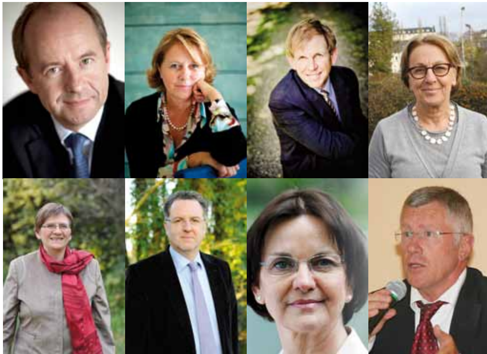
Les huit député-es de la majorité présidentielle dans le Finistère

Dans le Finistère, la gauche réalise, pour la première fois dans l'Histoire, le grand chelem. Il faut remonter à 1968 pour trouver une telle homogénéité. A l'époque les électeurs finistériens avaient élu huit député-es de droite (7 UDR et 1 RI). Quatre femmes et quatre hommes siègeront au Palais Bourbon, confirmant encore une fois que les socialistes du Finistère appliquent la parité.