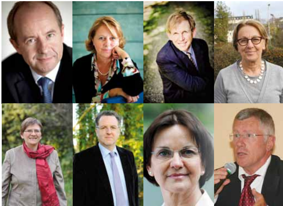
Les huit député-es de la majorité présidentielle dans le Finistère

Dans le Finistère, la gauche réalise, pour la première fois dans l'Histoire, le grand chelem. Il faut remonter à 1968 pour trouver une telle homogénéité. A l'époque les électeurs finistériens avaient élu huit député-es de droite (7 UDR et 1 RI). Quatre femmes et quatre hommes siègeront au Palais Bourbon, confirmant encore une fois que les socialistes du Finistère appliquent la parité.