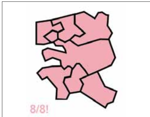
Carton plein pour la majorité présidentielle

Quel est le paysage politique finistérien à l'issue des élections Présidentielle et Législatives ?