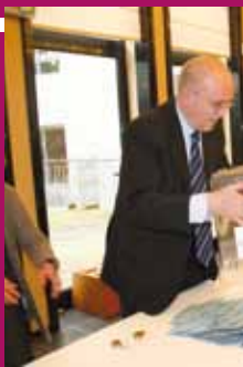
Quimper, le 1er avril