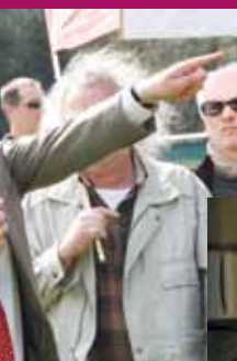
Le Relecq-Kerhuon, le 17 avril