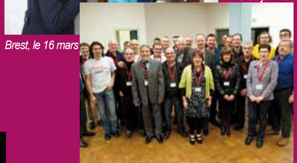
Brest, le 16 mars