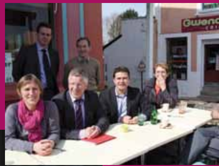
Quimperlé, le 1er avril