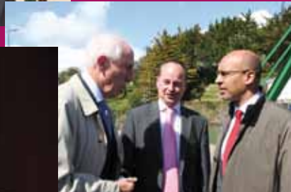
Port-Launay, le 20 avril