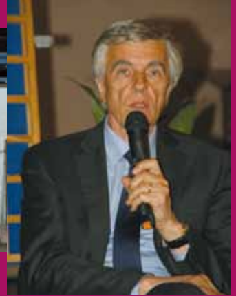
Quimper, le 10 avril