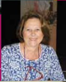
St-Pol-de-Léon, le 5 avril