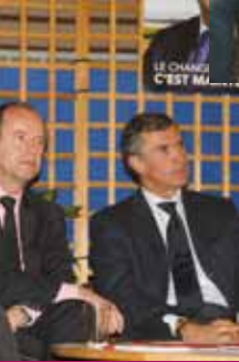
le 10 avril