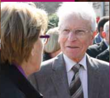
Châteaulin, le 31 mars