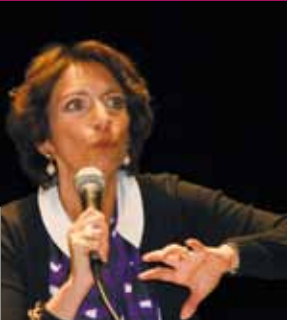
Brest, le 4 janvier