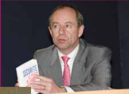
Bellevue, le 27 mars