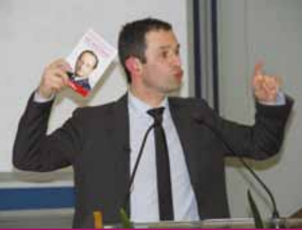
St-Renan, le 21 mars