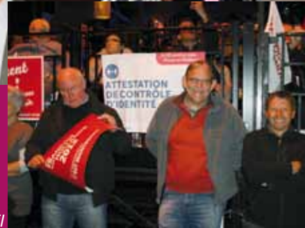
Rennes, le 4 avril