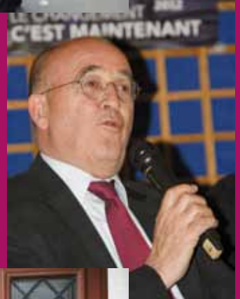
Quimper, le 10 avril