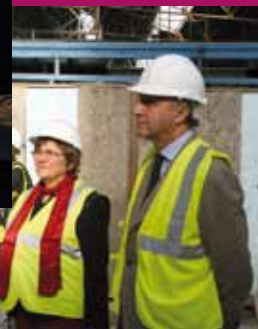
Landivisiau, le 1er mars