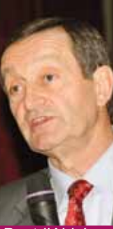
Pont-l'Abbé, le 2 mars