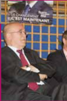
Quimper, le 1er avril