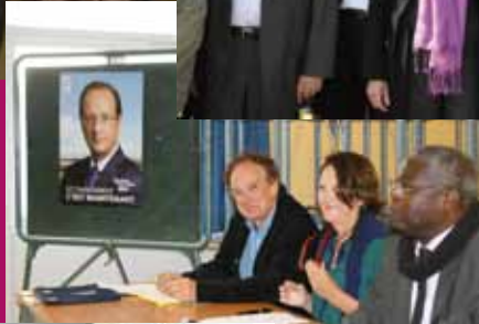
Brest, le 29 mars