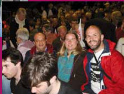
Rennes, le 4 avril