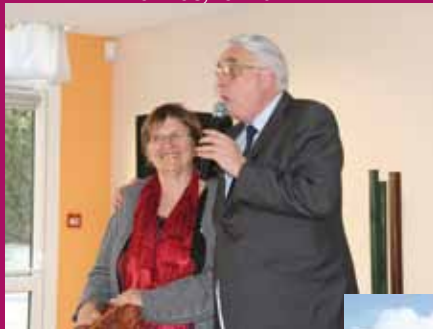
Moëlan-sur-Mer, le 20 avril