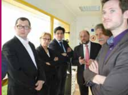
Landivisiau, le 11 avril