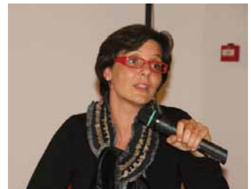
« Nous devons aider les installations »