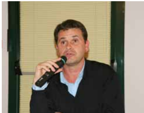
« La question du revenu est essentielle »