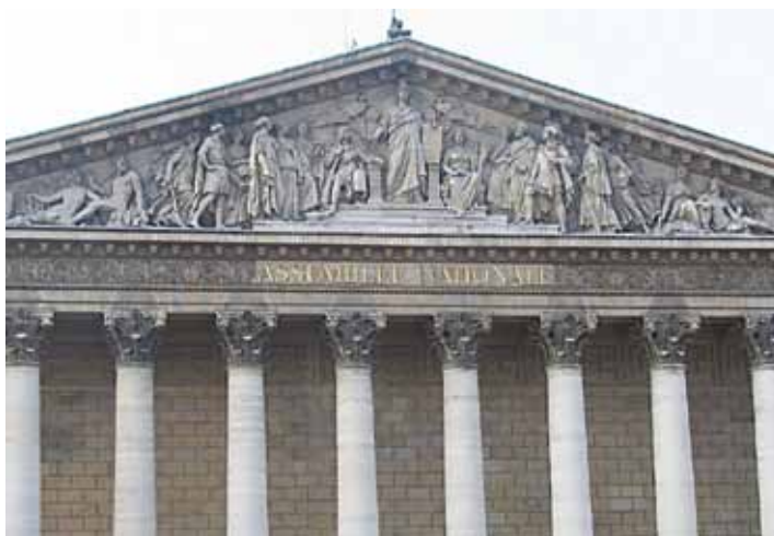
Les Législatives se dérouleront les 10 et 17 juin 2012

Dans les 1 ère (Quimper), 6 e (Châteaulin, Carhaix) et 8 e circonscriptions