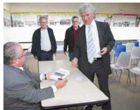
Séance de dédicaces

En revanche, Daniel Vaillant, ancien ministre de Lionel Jospin, défend fièrement le bilan du gouvernement de la gauche plurielle (1997-2002) qui a relancé la croissance, réduit le chômage et désendetté la France.