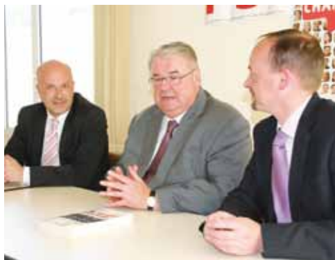
40 ans d'histoire(s)

Député-maire du 18 e arrondissement de Paris, Daniel Vaillant fut ministre des Relations avec le Parlement puis de l'Intérieur et secrétaire national du PS, chargé des Fédérations. Mais il est, avant tout, un militant.