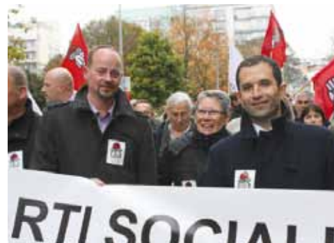
Benoît Hamon à Brest, le 6 novembre 2010

« Cela nous conforte dans notre conviction que cette réforme est