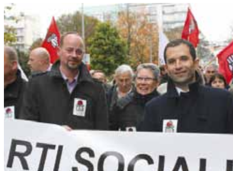
Benoît Hamon à Brest, le 6 novembre 2010

« Cela nous conforte dans notre conviction que cette réforme est