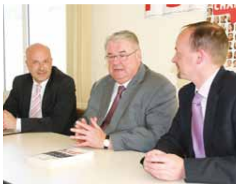
40 ans d'histoire(s)

Député-maire du 18 e arrondissement de Paris, Daniel Vaillant fut ministre des Relations avec le Parlement puis de l'Intérieur et secrétaire national du PS, chargé des Fédérations. Mais il est, avant tout, un militant.