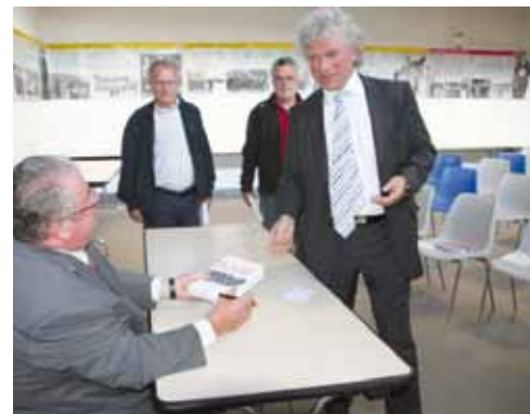
Séance de dédicaces

En revanche, Daniel Vaillant, ancien ministre de Lionel Jospin, défend fièrement le bilan du gouvernement de la gauche plurielle (1997-2002) qui a relancé la croissance, réduit le chômage et désendetté la France.