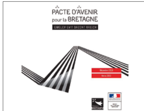
Élaboré en Bretagne, par les Bretons