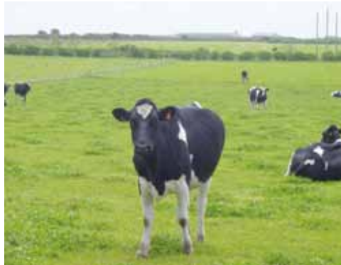
Le modèle breton doit évoluer

Au lendemain de l'annonce du plan du gouvernement pour la Bretagne, les conseillers généraux du Finistère, réunis en session, ont adopté un vœu demandant l'exonération de l'écotaxe pour la Bretagne.