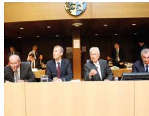
Guillaume Garot à Quimper, le 30 septembre