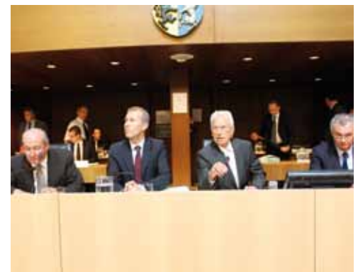
Guillaume Garot à Quimper, le 30 septembre