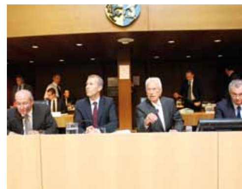
Guillaume Garot à Quimper, le 30 septembre