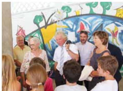
François Cuillandre avec des élèves brestois

Faisons confiance à tous les acteurs de la communauté éducative. Vouloir tirer un bilan au bout d'un mois alors que les changements sont si profonds n'a pas de sens.