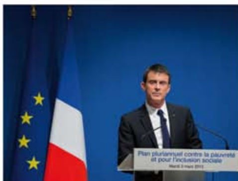
Une prime simple, efficace et juste

La dépense annuelle réservée à cette prime d'activité sera proche de 4 milliards d'euros. « C'est un budget en